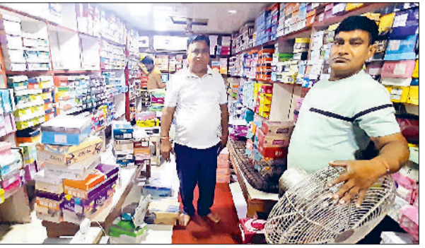
भूना। शहर की प्रतिष्ठित कंपनी चक्षु फूड प्राइवेट लिमिटेड में जल भराव के बाद बदतर हालात व सतीश बूट हाउस के बेसमेंट में पानी से बर्बाद हुए तालाब दिखाते हुए संचालक।

उनका कहना है कि प्रशासन के पास जल निकासी की कोई स्थाई व्यवस्था नहीं है। ऐसे में व्यापारी हर साल अपने हाथों से खड़ा किया कारोबार यूं ही मिट्टी में मिलते देखने को मजबूर हैं।