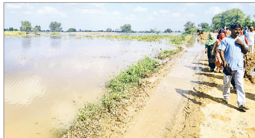
सिरसा। सेमनाला में आए कटाव से खेतों में घुसा पानी।

सिंचाई विभाग व जिला प्रशासन के अधिकारी मौके पर पहुंचे