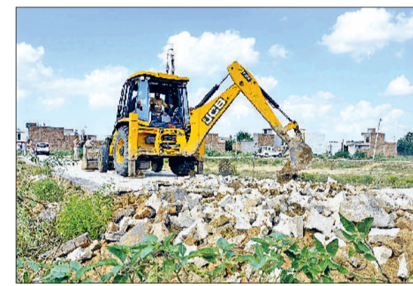
फतेहाबाद। कालोनी में अवैध निर्माण तोड़ती जेसीबी मशीन।

■ विभाग की टीम ने जेसीबी से निर्माण कार्य को तोड़ा