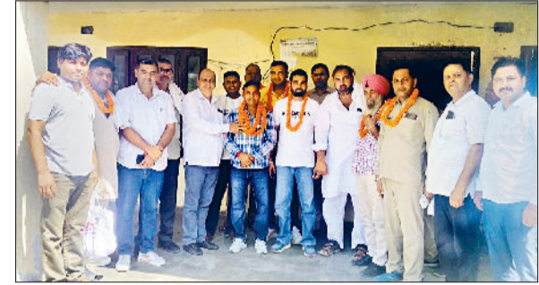
फतेहाबाद। रोडवेज कर्मचारी यूनियन के चुने गए पदाधिकारी।

प्रतिनिधि उनकी सुध लेने को तैयार नहीं है।