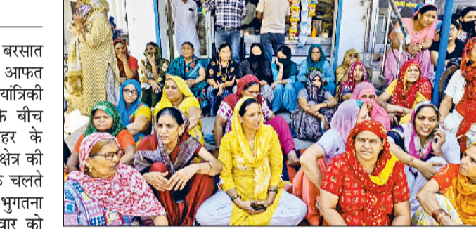
सिरसा। सीवरेज समस्या के विरोध में घरना व सड़क जाम करते लोग।