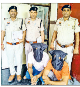
फतेहाबाद। पुलिस गिरफ्त में महिला की जमानत करवाने वाले दोनों युवक।

■ महिला की जमानत के लिए किया था फर्जी दस्तावेजों का उपयोग