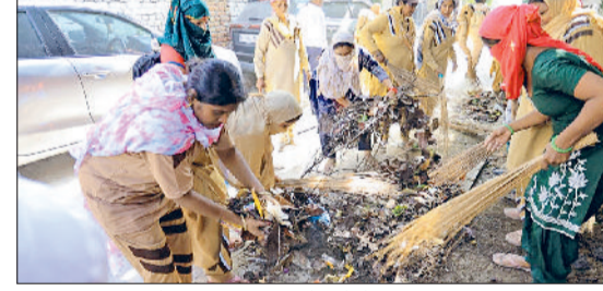
सिरसा। गुरुग्राम में सफाई अभियान में जुटे डेरा श्रद्धालु।

सेवादारों ने सफाई कार्य को किया। सफाई अभियान के दौरान मुख्यमंत्री नायब सिंह सैनी ने डेरा सच्चा सौदा के योगदान की सराहना भी की। साथ ही मुख्यमंत्री सैनी ने कहा कि डेरा सच्चा सौदा के अनुयायियों की भारी संख्या में उपस्थिति सराहनीय है। मैं उन्हें बधाई और साधुवाद देता