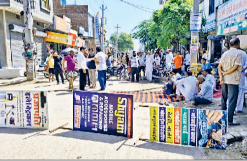
सिरसा। सीवरेज समस्या के विरोध में घरना व सड़क जाम करते लोग।

साथ लेकर डीसी से मिले थे। डीसी के हस्तक्षेप के बाद गुरुवार को पब्लिक हेल्थ विभाग के कार्यकारी अभियंता नगर परिषद कार्यालय पहुंचे। उन्होंने चेयरमैन व पाषंडों से सीवरेज को लेकर आ रही परेशानी व समस्याओं के संबंध में चर्चा की और शीघ्र ही इस पर काम करने का आश्वासन दिया। रोष जाहिर कर रहे लोगों ने गलियों में सीवरेज पानी के ठहराव हो गया है और गड्डों में गिरकर लोग चोटिल रहे हैं। हरिविष्णु कॉलोनी के लोगों ने कंगनपुर रोड पर जाम लगा दिया और शासन प्रशासन की उदासीनता के प्रति नारेबाजी कर अपना आक्रोश प्रकट किया। जाम लगाने वाले क्षेत्रवासियों ने बताया कि उनके क्षेत्र में पिछले 15 दिनों से बरसाती पानी एवं सीवरेज का पानी ठहरा हुआ है और उसके कारण छोटे छोटे बच्चों को स्कूल आने जाने