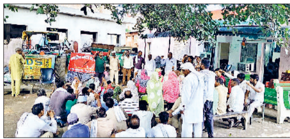
फतेहाबाद। नगरपरिषद प्रांगण में रोष जताते कर्मचारी।